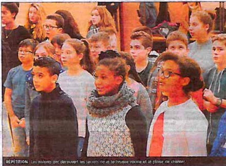
REPÉTITION. Les enfants ont découvert les secrets de la technique vocale et le plaisir de chanter.

Les enfants se sont aussi demandés si le prince aurait pu tomber amoureux de Cendrillon s'il l'avait vue en souillon. L'ex-