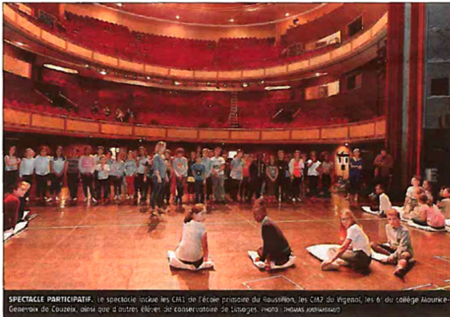
SPECTACLE PARTICIPATIF. Le spectacle inclue les CM1 de l'école primaire du Roussillon, les CM2 du Vigenal, les 6 e du collège Maurice-Genevoix de Couzeix, ainsi que d'autres élèves du conservatoire de Limoges.

« J'ai écrit le texte en m'inspirant des idées des enfants. On ne voulait pas une version 2018 du conte, mais plutôt une suc-