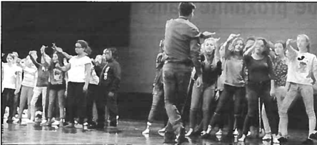
Les élèves en répétition sur la scène de l'Opéra.

C'est une singulière création musicale pour enfants, soprano, comédien et ensemble instrumental que présente l'Opéra de Limoges, ces 29, 30 juin et 1 er juillet. Un projet pédagogique mené avec une centaine d'élèves haut-viennois autour de «Cendrillon» revisitée, comme une allégorie de notre société.