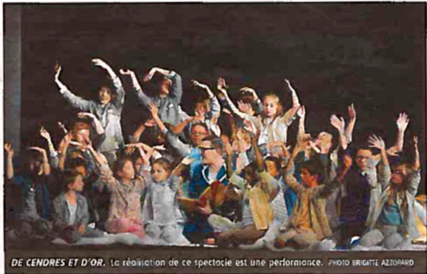
DE CENDRES ET D'OR. La réalisation de ce spectacle est une performance.

Le spectateur perçoit combien le travail avec eux a été exigeant et intelligent. Leurs voix d'enfants sont bien sûr touchantes. La vision de Cendrillon portée par le livret de Thomas Gornet est passionnante. Elle interroge